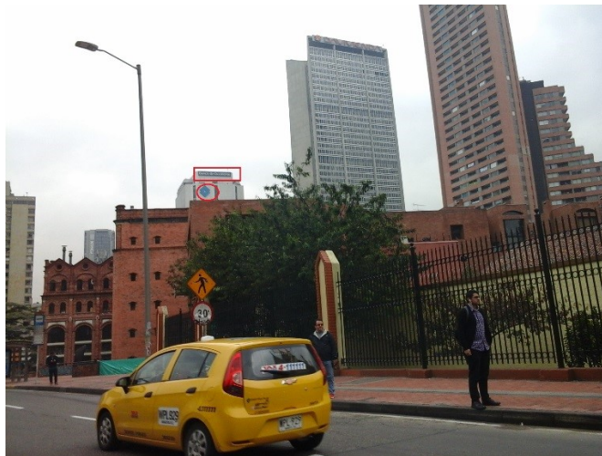
Fotografía No. 3. Elementos de Publicidad Exterior Visual instalado en la Carrera 13 No. 27 – 43 con sentido de orientación visual sobre la Calle 28 (conducta 2 evidenciada). Fecha de Visita: 23/11/2016, visita de control y seguimiento en la Localidad de Santa Fe.