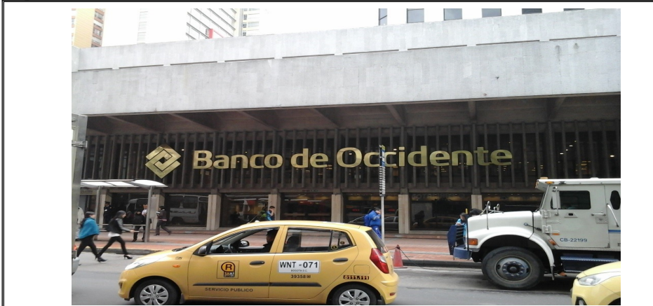
Fotografía No. 1. Elementos de Publicidad Exterior Visual instalado en la Carrera 13 No. 27 – 43 con sentido de orientación visual sobre la Carrera 13 con solicitud de registro 2016ER30897 del 18/02/2016. Fecha de Visita: 23/11/2016. visita de control y seguimiento en la Localidad de Santa Fe.