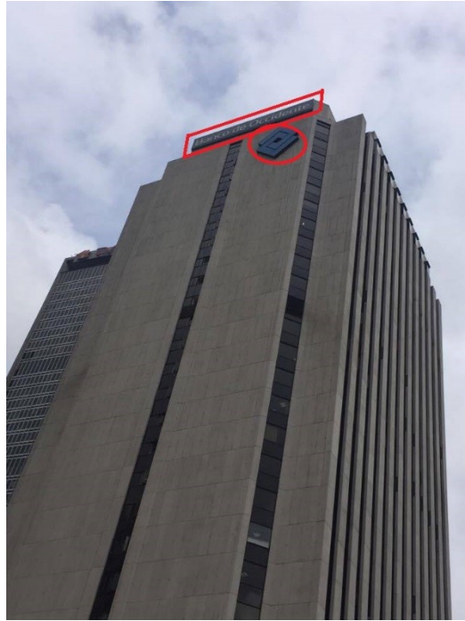
Fotografía No. 4. Elementos de Publicidad Exterior Visual instalado en la Carrera 13 No. 27 – 43 con sentido de orientación visual sobre la Calle 26C (conducta 2 evidenciada). Fecha de Visita: 23/11/2016, visita de control y seguimiento en la Localidad de Santa Fe.